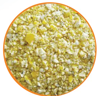
Alimento de postura con GRANUMIX

Proceso de granulación de partículas sin el uso de calor o humedad.